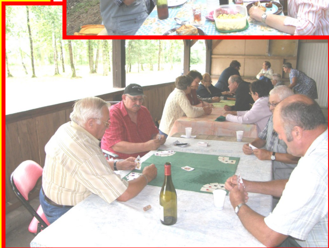
Pique-nique à Bauzy