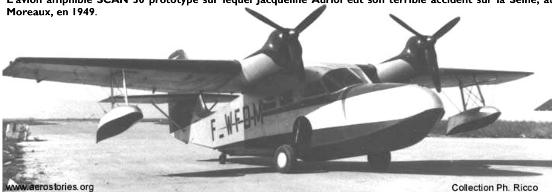
L'avion amphibie SCAN 30 prototype sur lequel Jacqueline Auriol eut son terrible accident sur la Seine, aux Mureaux, en 1949.