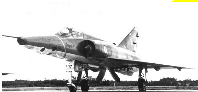
Dassault Mirage III R de reconnaissance photo. C'est sur ce type d'appareil que Jacqueline Auriol établit un record de vitesse avec 2030 km/h de moyenne.