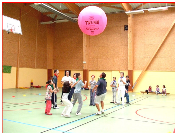
Une partie de Kin-ball appréciée par tous