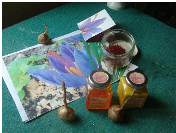
Fleur de safran en photo, bulbes, miel de safran, moutarde de safran, safran (dans le bocal)

Il faut entre 150 et 200 fleurs pour obtenir un gramme de safran... Mickaël Da Costa espère récolter 200 grammes cette année ! Un travail gigantesque en perspective.