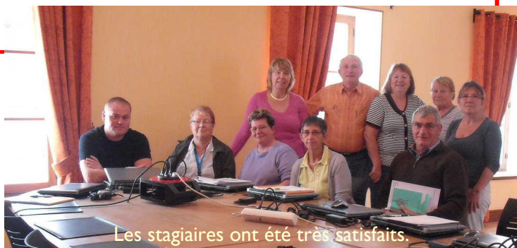
Les stagiaires ont été très satisfaits.

La prochaine session Internet, aura lieu le 7 novembre 2011.